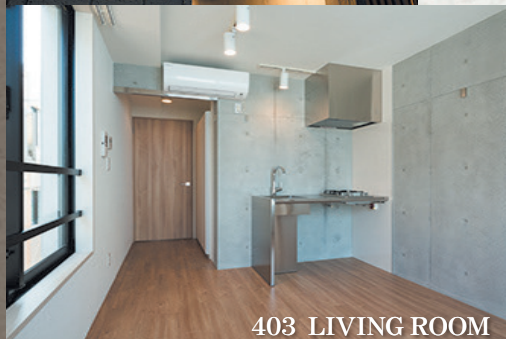
403 LIVING ROOM