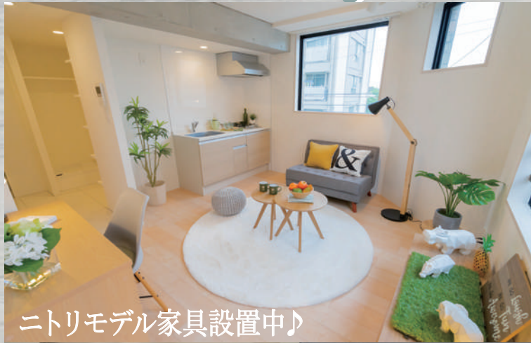
ニトリモデル家具設置中♪