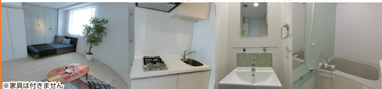
※家具は付きません