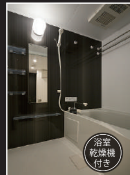
浴室 乾燥機 付き