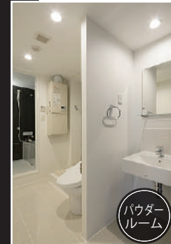
パウダ ー ルーム