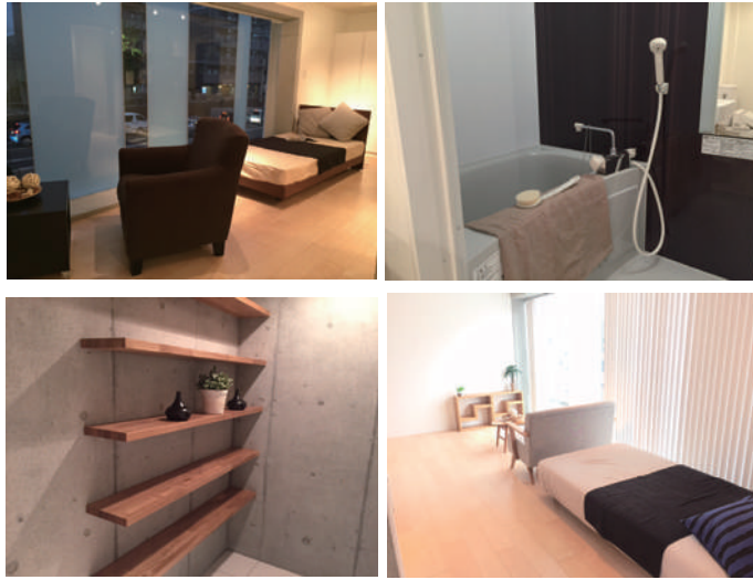
※家具はつきません。