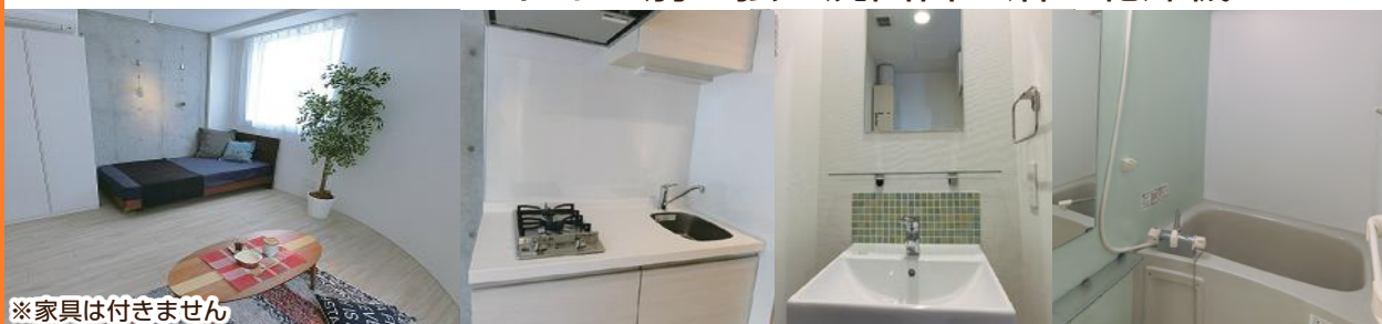
※家具は付きません