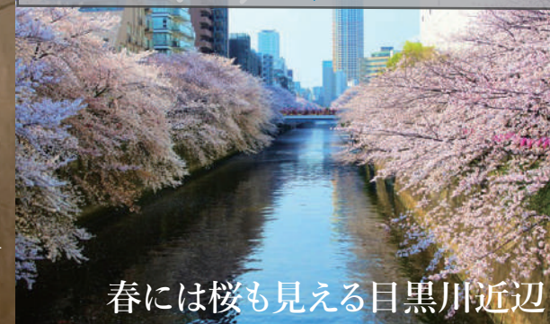
春には桜も見える目黒川近辺