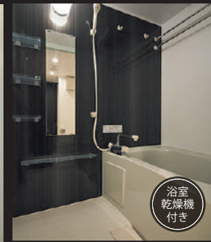
浴室 乾燥機 付き