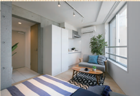
Room Layout Image