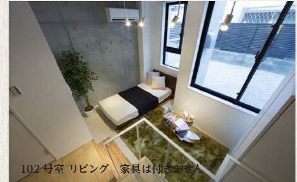
102号室 リビング 家具は付きません